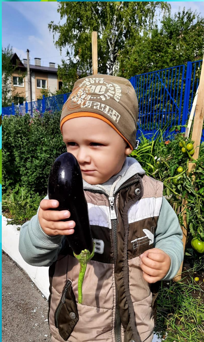
Сбор урожая с огорода детского сада